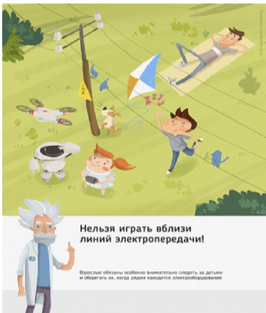
Рис.3 Нельзя играть вблизи линий электропередачи