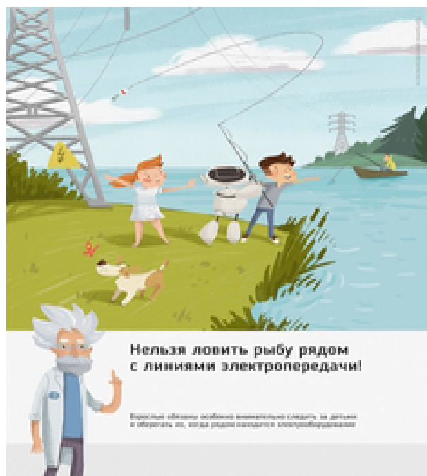
Рис. 4 Нельзя ловить рыбу рядом с линиями электропередачи

Об открытых подстанциях, оборванных проводах нужно сообщить в Кубанское ПМЭС по телефону 8-861-219-40-20 или позвонить на единый телефон всех экстренных служб 112.