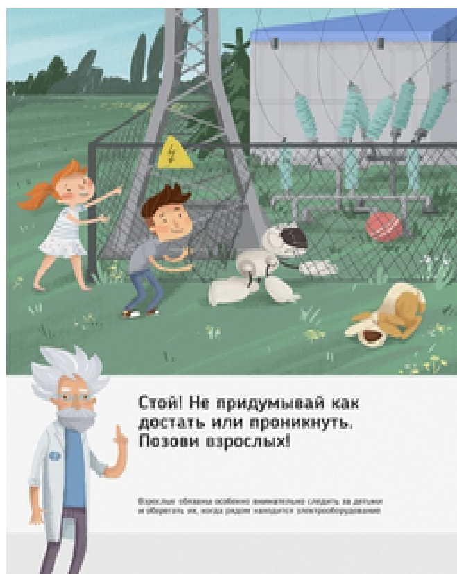
Рис. 5 Стой! Не придумывай как достать или проникнуть. Позови взрослых!